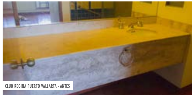
CLUB REGINA PUERTO VALLARTA - ANTES