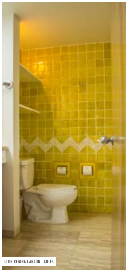
CLUB REGINA CANCÚN - ANTES

Tratamos de alcanzar un balance entre mantener bajas las cuotas de mantenimiento y mantener los desarrollos en la mejor condición posible. Adicionalmente, muchos de los proyectos de mejoras requieren dar de baja algunas unidades, así que tratamos de que el efecto sea el mínimo posible. En los últimos años hemos estado trabajando en mejorar los baños en los tres desarrollos Club Regina, y queremos compartir con usted los trabajos hechos.