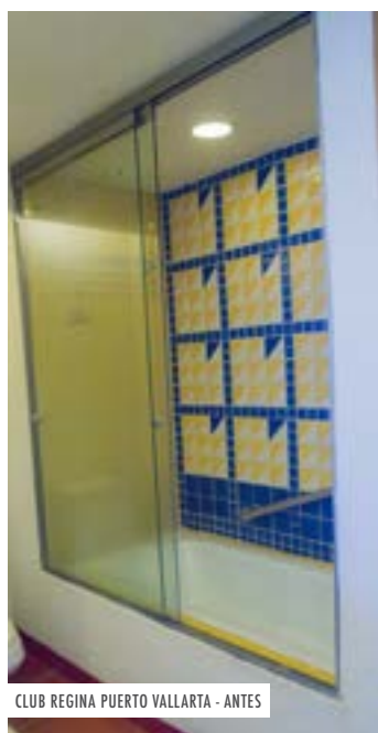
CLUB REGINA PUERTO VALLARTA - ANTES