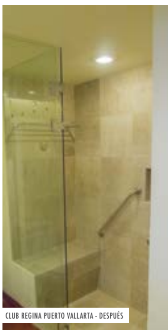
CLUB REGINA PUERTO VALLARTA - DESPUÉS