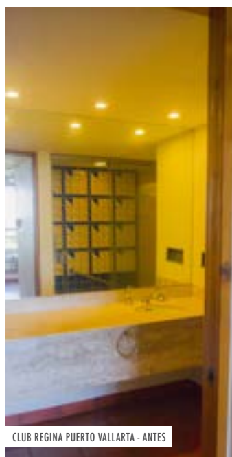
CLUB REGINA PUERTO VALLARTA - ANTES