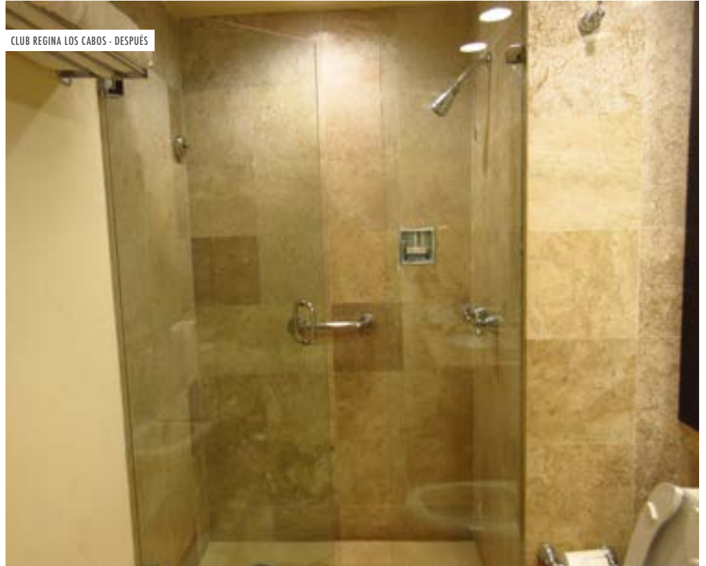
CLUB REGINA LOS CABOS - DESPUÉS

Por favor tome un momento para ver las fotos de antes y después que hemos incluido y que muestran la gran diferencia que estos trabajos están haciendo en nuestros desarrollos. Continuaremos trayéndole información sobre nuestros proyectos de mejoras, tanto como los que puede apreciar cuando visita como los que se hacen tras bambalinas.