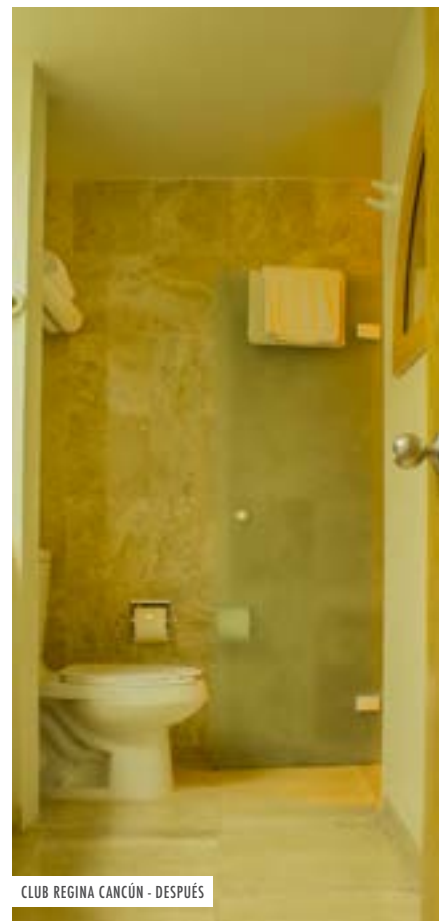
CLUB REGINA CANCÚN - DESPUÉS