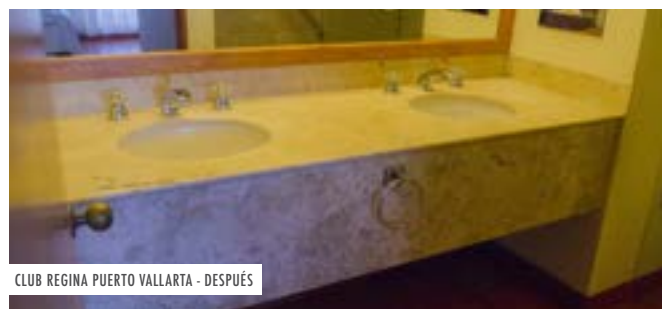
CLUB REGINA PUERTO VALLARTA - DESPUÉS