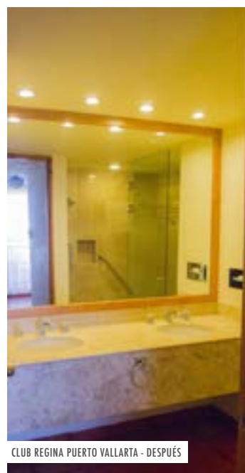
CLUB REGINA PUERTO VALLARTA - DESPUÉS