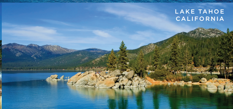
LAKE TAHOE CALIFORNIA