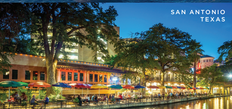
SAN ANTONIO TEXAS